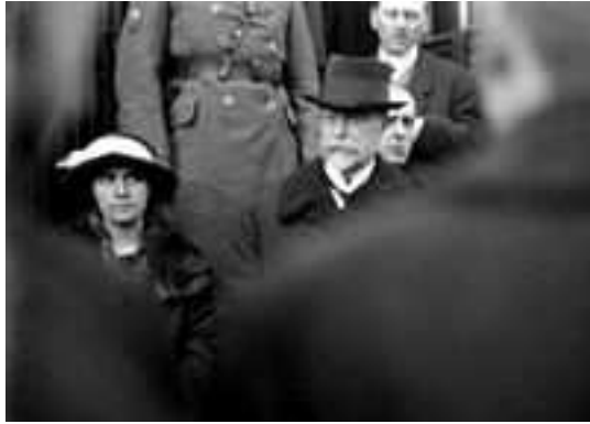
TGM wysiada z pociągu, w lewo córka Olga

W 1918 roku odbył także podróż do USA, gdzie spotkał się z prezydentem Woodrowem Wilsonem. W USA agitował za niepodległością Czechosłowacji, w takich granicach aby jego kraj uznać za nację szczególną. 18 października 1918 roku Masaryk, stojąc na stopniach waszyngtońskiego Kapitolu, proklamował niepodległość Czechosłowacji. Po miesiącu wrócił do ojczyzny.