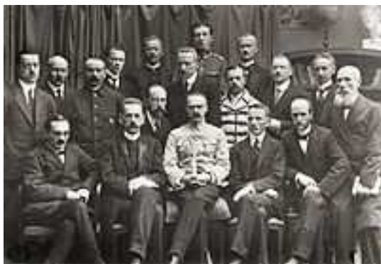
Rząd Jędrzeja Moraczewskiego 18 listopada 1918. W pierwszym rządzie siedzą (od lewej): Stanisław Thugutt, Jędrzej Moraczewski, Józef Piłsudski, Leon Supiński, Leon Wasilewski

14 listopada Rada Regencyjna rozwiązała się, przekazując Józefowi Piłsudskiemu, jako Naczelnemu Dowódcy WP, całość posiadanej przez siebie władzy zwierzchniej w Królestwie Polskim i zobowiązując go jednocześnie do przekazania jej przyszłemu rządowi narodowemu. W ustanowionym tego dnia dekretem własnym Naczelnym Dowódcą zmienił nazwę państwa na Republika Polska. Dwa dni później Piłsudski notyfikował mocarstwom powstanie niepodległego państwa polskiego. Jako faktyczna głowa państwa na stanowisko Prezydenta Ministrów Piłsudski wyznaczył Ignacego Daszyńskiego. Wobec sprzeciwu stronnictw politycznych co do osoby premiera, Daszyński sformował rząd oraz podał się do dymisji, zaś na jego miejsce został desygnowany Jędrzej Moraczewski, jako