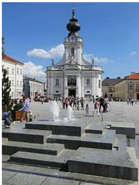
Plac Jana Pawła II z bazyliką Ofiarowania Najświętszej Maryi Panny