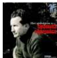
Tadeusz Różewicz: Mezi apokalypsou a ..