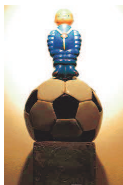
Wojciech Kuczok Zápisky - Tatranská dobrodružství